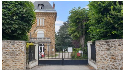
La maison du Dr Tenon