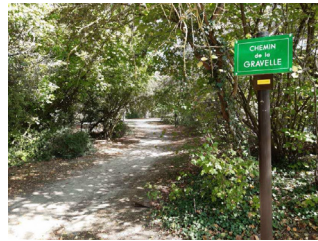
Le chemin de la Gravelle