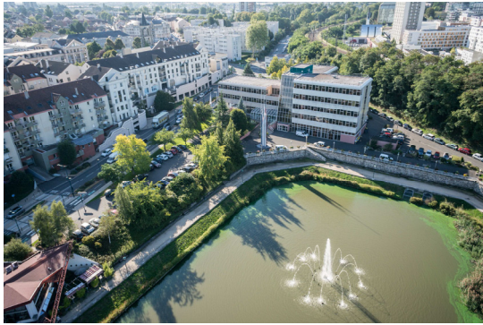
Le centre ville de Massy